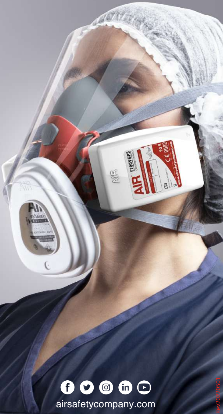
Lámina transparente de protección para el rostro y los ojos del usuario en ambientes con riesgos de exposición de aerosoles y gotículas expulsadas por terceros.